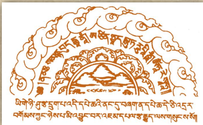
此咒置经书中可灭误跨之罪

sa rva sa tva vi ja ya ma nu sma ra svā hā 薩 嚩 薩 怛 嚩 尾 惹 野 麼 弩 娑 麼 囉 娑 嚩 賀。